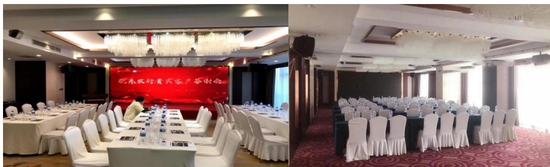
四楼黄山厅（含投影）