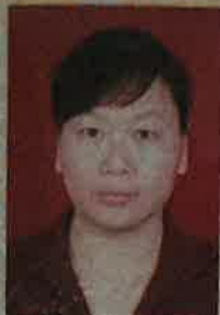
(加盖批准机关钢印有效) Valid with embossed seal