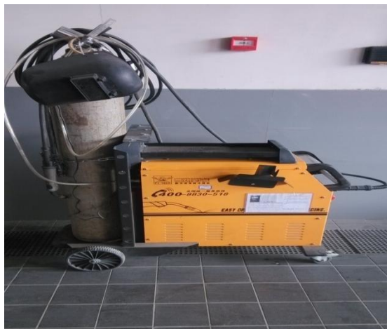
带气动双面电焊多功能修复机