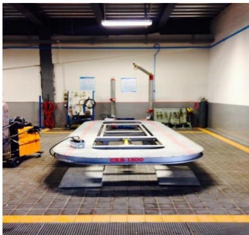
万德车身板金校正仪