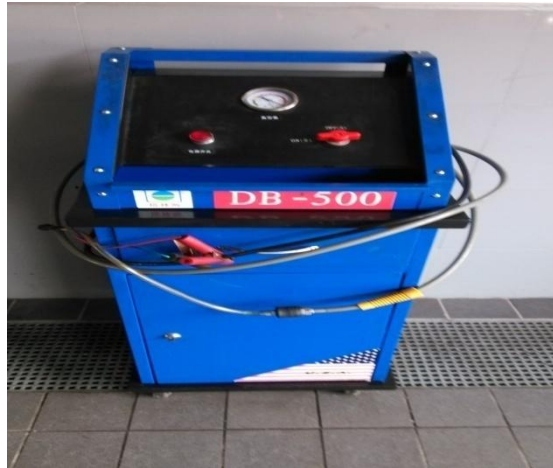
12V 电动豪华型刹车油更换清洗机