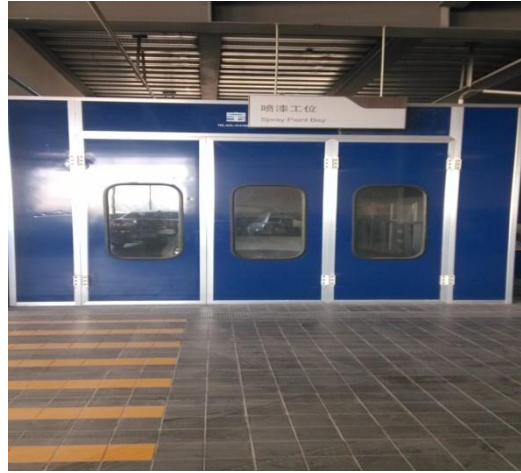
环保式量子烤漆房