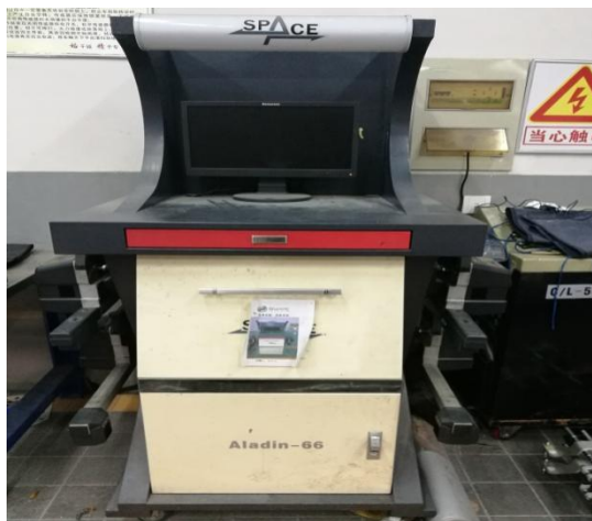
SPACE 8 束 CCD 蓝牙四轮定位仪