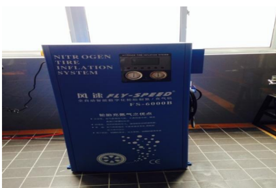
风速牌全自动轮胎制氮/充气机