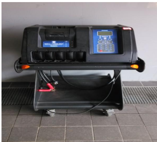
SGM 电瓶检测及充电系统