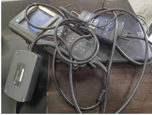
TECH-标准版车辆故障诊断仪