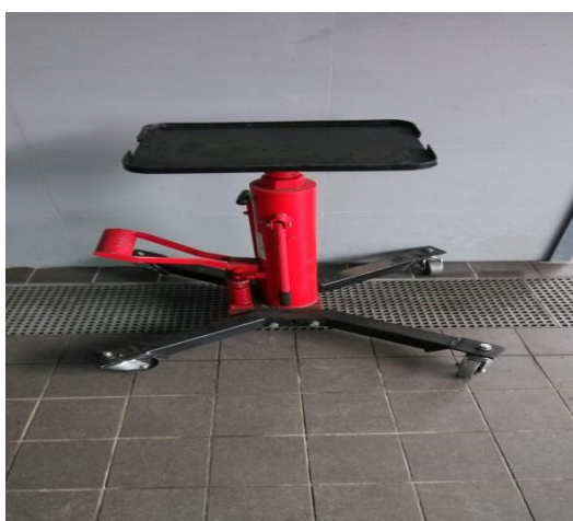
发动机高位动送器