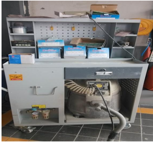
豪华型无尘干磨机