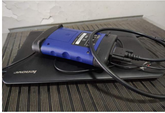
32 MEG CARD