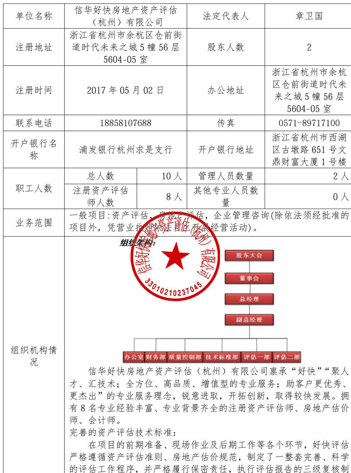
供应商基本情况表