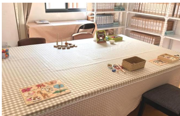
咨询评估室 36.72 平方米