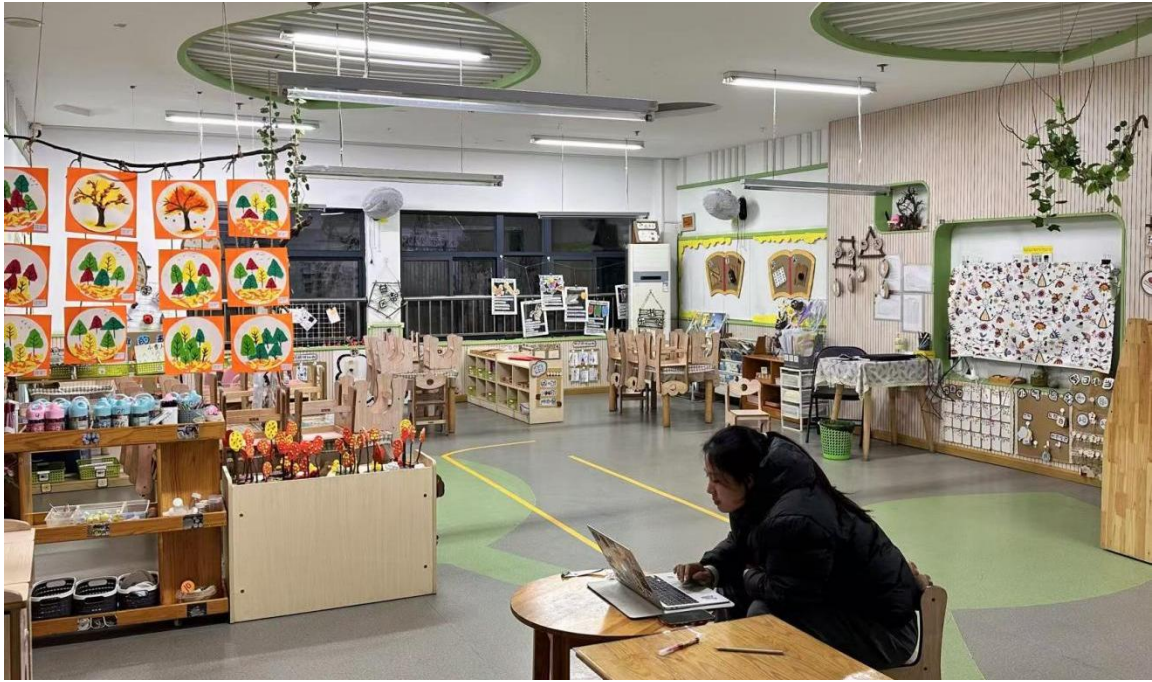
集体教室（2）内含游戏活动区 77.76 平方米