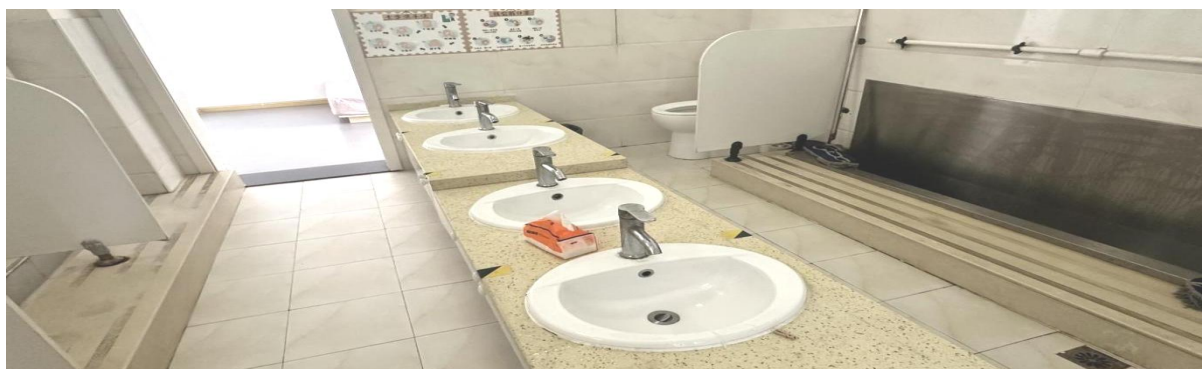
生活自理能力训练区 77.76 平方米