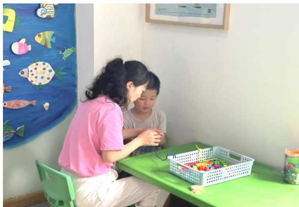
个训室(4) 77.76 平方米