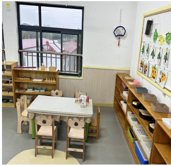
集体教室（1）内含游戏活动区 77.76 平方米