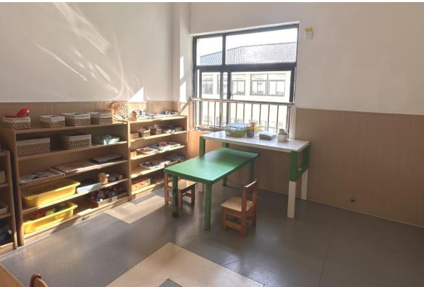
个训室 (3) 12.96 平方米