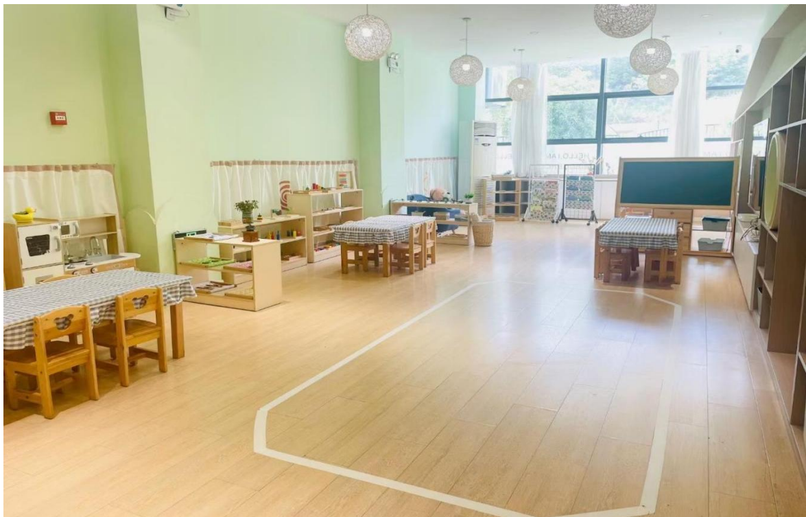
集体教室（3）内含游戏活动区 77.76 平方米