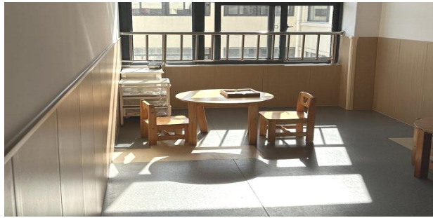
个训室 (1) 19.44 平方米